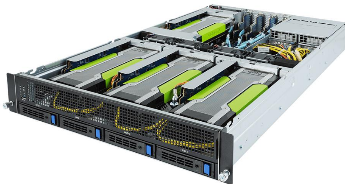
Рис.2 – Серверная платформа QSRV-260422GPU (вид сверху)

Собственный сервисный центр и центр технической поддержки обеспечивает качественное гарантийное и пост-продажное обслуживание, доступ к обновлениям программного обеспечения, а также консультационную поддержку по настройкам оборудования.